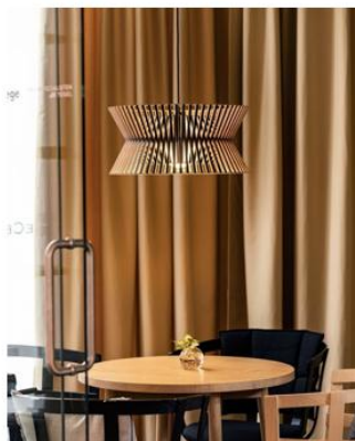
© Secto Design - Mattias Hamrén