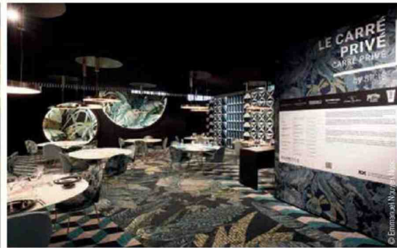
Le Carré privé ( EquipHotel 2022).

A n peu plus de six mois de son ouverture, EquipHotel , qui aura lieu du 3 au 7 novembre 2024 à Paris Porte de Versailles, lève déjà la voile sur son contenu, ou au moins sur son état d'esprit, qui se traduit dans une invitation à aller de l'avant, et à profiter des vents