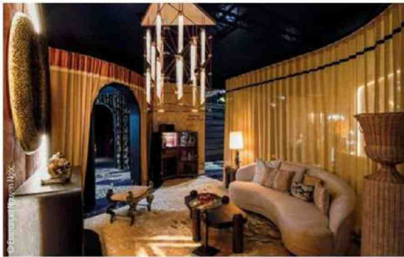
La Chambre by Laurent Mangoust ( EquipHotel 2022).